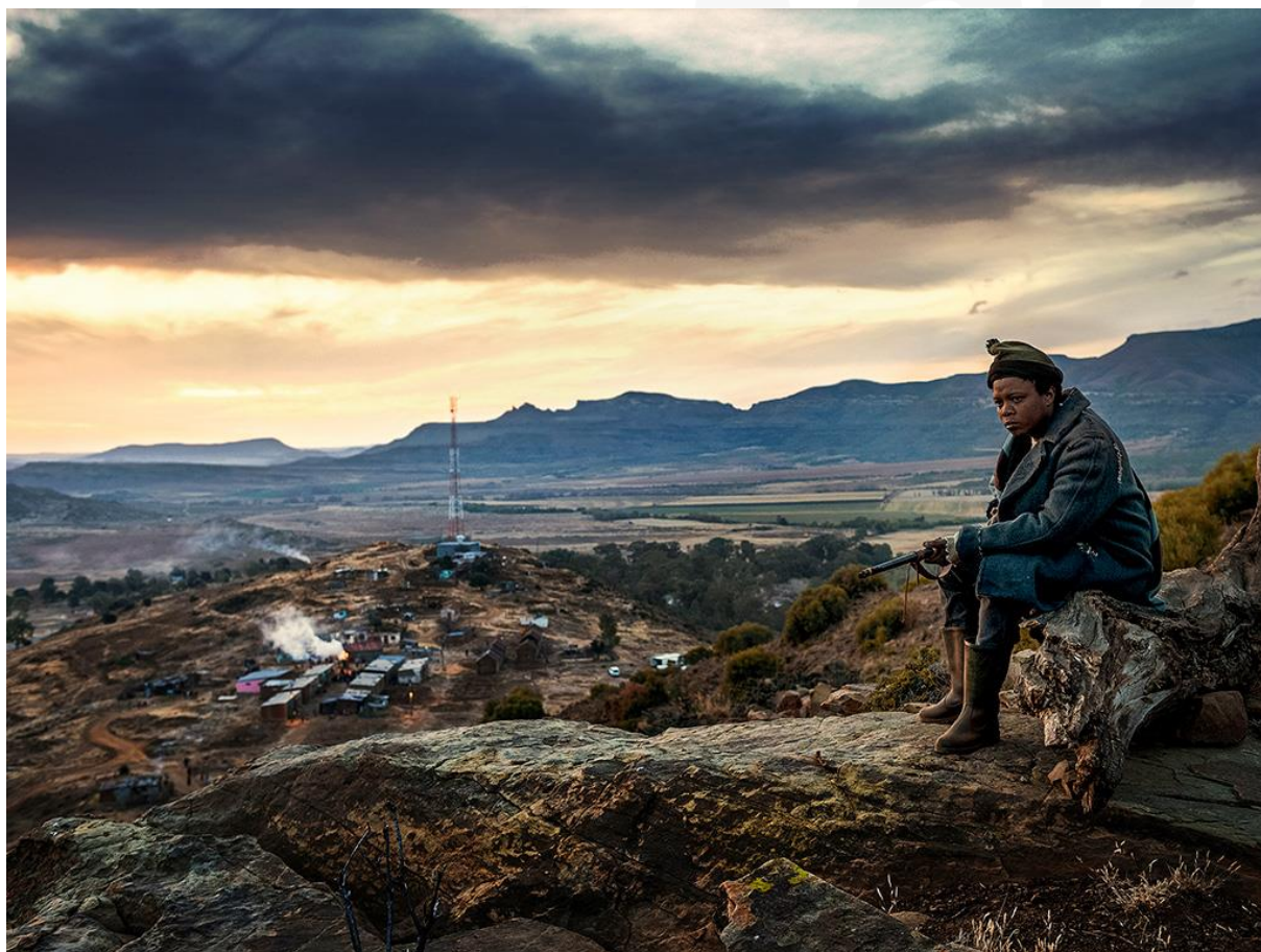
Pięć palców dla Marsylii reż. Michael Matthews

Zamknijemy festiwal pokazem filmu Pięć palców dla Marsylii reż. Michael Matthews , znakomicie przyjętym na międzynarodowych festiwalach filmowych m.in. na MFF Toronto (2017) , FF Londyn (2017) , MFF Palm Springs (2018) . Jest to niezwykle film łączący elementy spaghetti westernów i postapartheidowskiego południowoafrykańskiego dramatu.