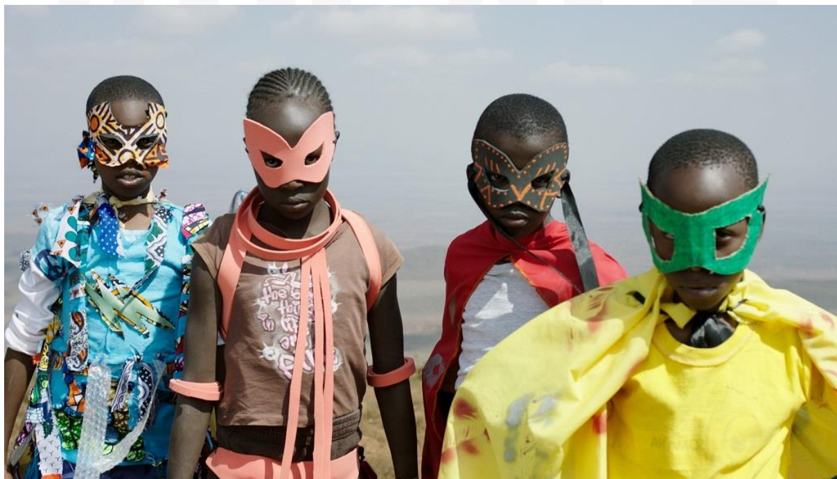
SUPA MODO reż. Likarion Wainaina

XIII Festiwal AfryKamera otworzy wyróżniony na MFF w Berlinie film SUPA MODO reż. Likarion Wainaina . To opowieść o Jo, dziewczynce, która kocha kino i marzy o tym, by zostać superbohaterem. Niestety cierpi na nieuleczalną chorobę. Gdy wychodzi ze szpitala, jej nadopiekuńcza matka stara się chronić ją przed wszystkim, co mogłoby zagrozić jej zdrowiu. Czyli chce za wszelką cenę zatrzymać ją w domu. Tymczasem starsza siostra dostrzega w Jo potencjał na prawdziwego superbohatera. Z pomocą całego miasteczka postanawia zrobić wszystko, by spełnić jej największe marzenie. Premiera polska